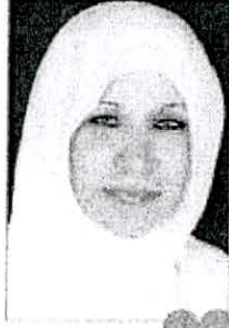
تنسيق مع الأقسام العلمية في الكليات لفتح شعب رياح النجادة

تنطلق من 22 حتى مايو 24 الجاري. مضيغاً أن العمادة تحصر طلبات من فئة خريجي الفصل الصيفي، والمتوقع تخرجهم في الفصل الدراسي الأول منن لم تتوفر مقرراتهم للسماح لهم بالتسجيل في «الصفى» المقبل. وتنسق مع الأقسام العلمية بالكليات لفتح شعب إضافية جديدة عبر مكاتب التسجيل. وأوضحت النجادة أن العمادة تعمل جاهدة على تذليل كافة المشاكل والصعوبات، التي تواجه الطلبة بناء على ما تقتضيه الدوائح والقوانين متمنية التوفيق والسداد لهم.